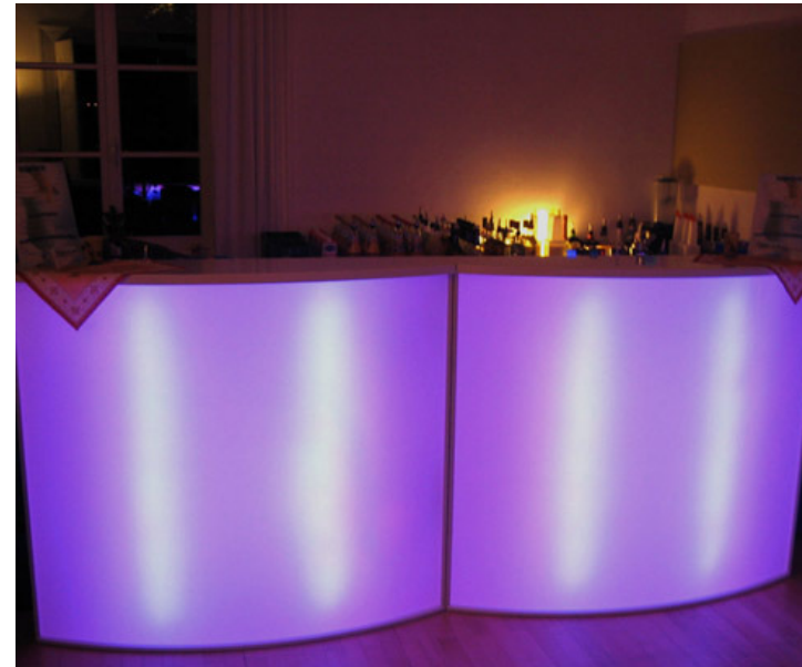
Beispiel einer Theke

Alle genannten Preise verstehen sich zuzüglich der gesetzlichen Mehrwertsteuer.